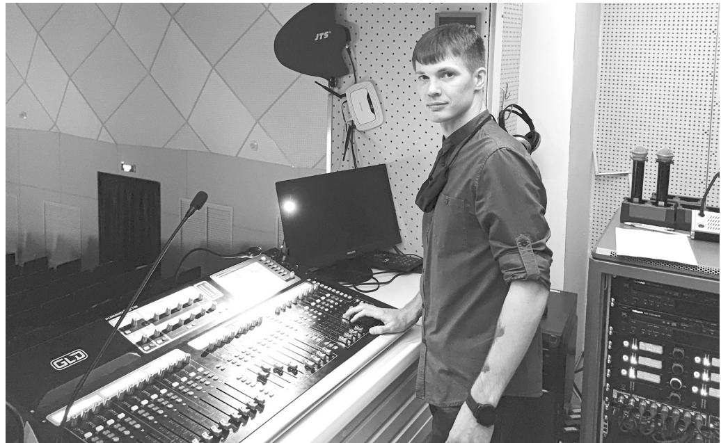
Юнкоры побывали на экскурсии в операторской, где им показали знаменитое новейшее оборудование «Родины»

– Трудно представить и даже вспомнить, сколько необыкновенных и одаренных людей были гостями на сцене ДК «Родина» за годы ее работы. Запомнились встречи с актерами Петром Глебовым, Зинаидой Кириенко, Николаем Рыбниковым, Аллой Ларионовой, Василием Лановым, Владимиром Этушем; музыкантом Андреем Макаревичем и телеведущим Владом Листьевым. А еще в «Родине» выступали замечательные музыкаль-