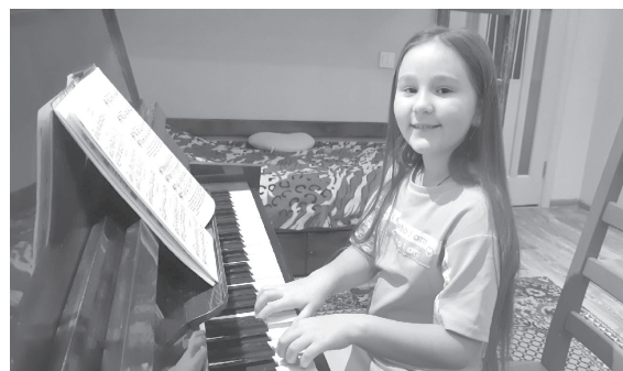
Если меня спросят: какое из моих увлечений лучшее, то я отвечу: «ВСЁ!!! ВСЁ!!!».