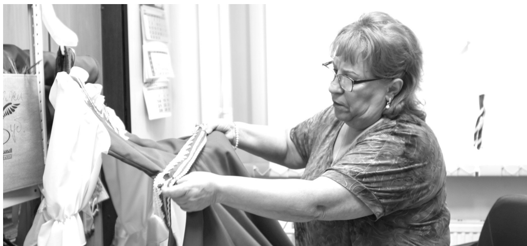
В костюмерной «Родины» хранится около 3000 костюмов!