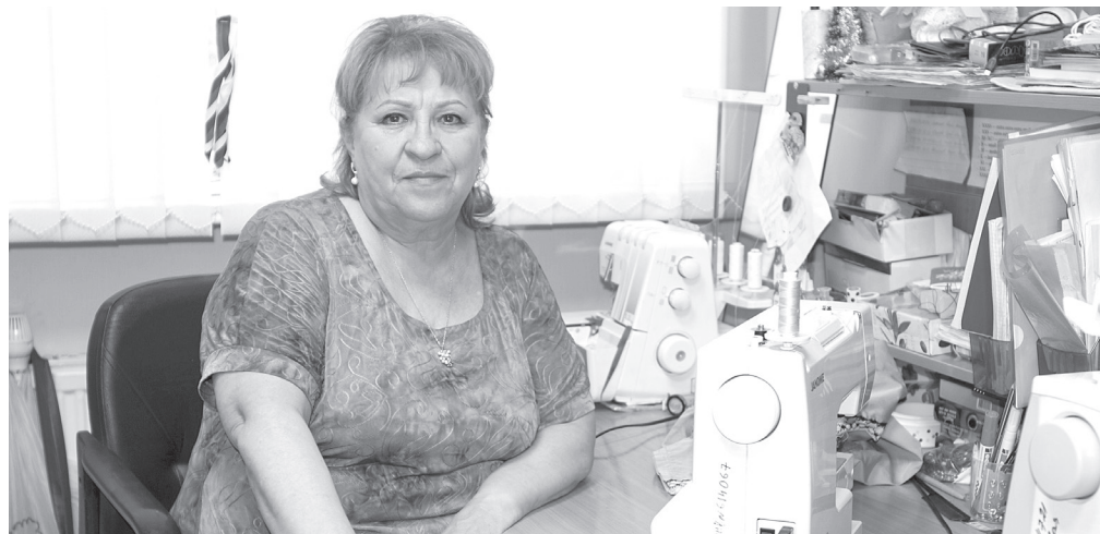
Галина Сергеевна отдала 50 лет творчеству, а из них - 10 лет костюмерному делу

ОДНАЖДЫ ГАЛИНЕ СЕРГЕЕВНЕ ПРИШЛО СШИТЬ 37 ЮБК ЗА ПОЛТОРЫ НЕДЕЛИ!!! ОНА СТАРАЛАСЬ ИЗО ВСЕХ СИЛ, ЧТОБЫ УСПЕТЬ К КОНЦЕРТУ, СДЕЛАТЬ КАЧЕСТВЕННО И КРАСИВО. В ИТОГЕ, БЛАГОДАРЯ КОСТЮМАМ И ДВИЖЕНИЯМ, НОМЕР ПОЛУЧИЛСЯ ЗАВОРАЖИВАЮЩИМ. ОБЩУЮ КАРТИНУ ТАНЦА ДОПОЛНИЛИ СВЕТ И ЗВУК.