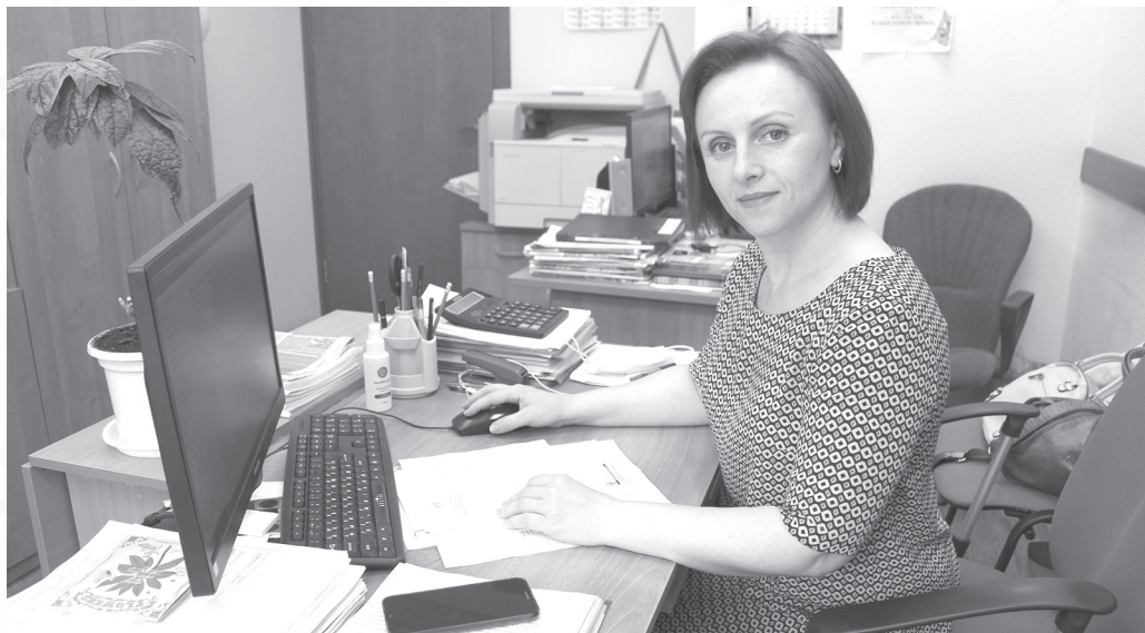
Методисты «Родины» получили специальный диплом «За лучшую постановку информационно-издательской деятельности»