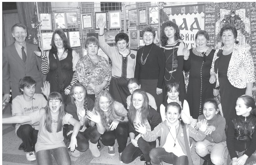
Празднование 40-летия «Родины»